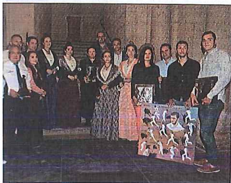
Los ganadores de la pasada temporada, tanto en la modalidad de corrida camarguesa como de festejo tradicional, recogieron sus galardones.